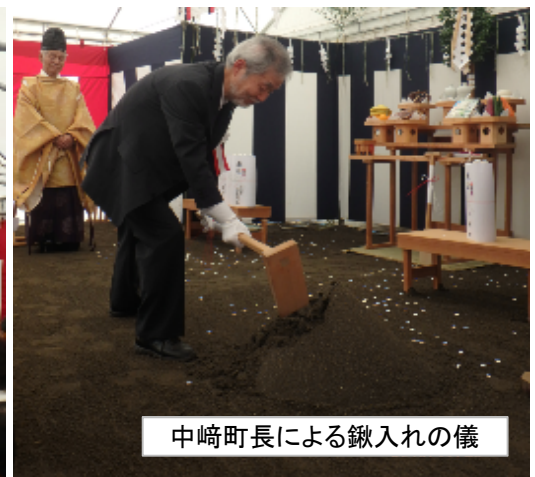
中崎町長による鍬入れの儀