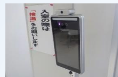
▲エコセンター大磯受付