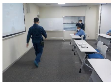
▲飲酒運転再現メガネ体験