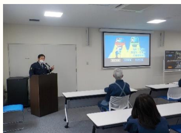
▲夜間時における交通事故の現状を受講

飲酒運転の状態を再現できるメガネをかけ、床に置いたゴルフボールを拾う体験をしましたがまっすぐ歩くことすら難しく、こんな状態での運転はとても危険で改めて飲酒運転の恐ろしさを学ぶことができました。