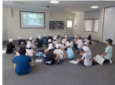
▲施設紹介映像の視聴