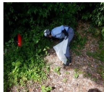
▲当日の清掃活動の様子