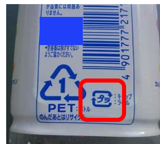
▲プラマークが目印です