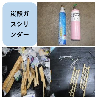
炭酸ガス スリ ンダー