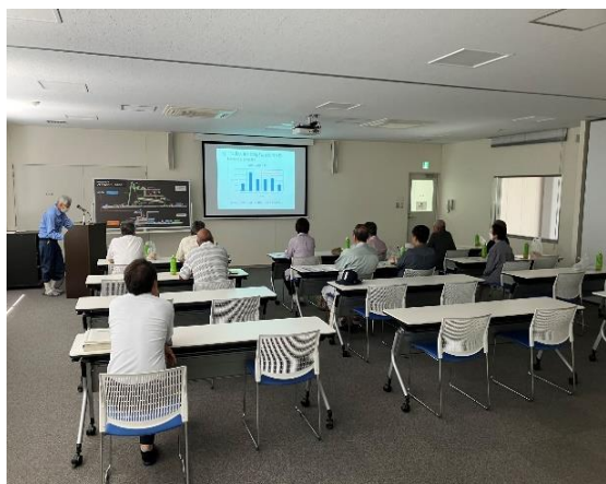
▲施設紹介時の様子

当日は施設紹介DVDの視聴や施設見学を行い地元地区の皆様との交流を交え運営状況報告をさせていただきました。今後も定期的を開催していきます。