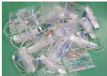
▲点滴チューブ・針など