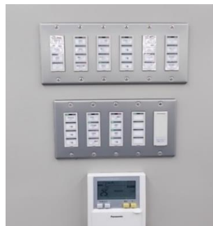
▲電灯・エアコン集中操作盤

また、施設全体の電灯やエアコンの スイッチは集中操作ができるよう になっており、スイッチのON/OFFが1カ 所で出来るようになっていきます。