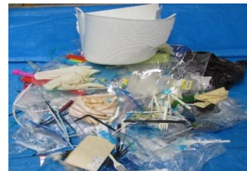
▲プラスチック製品など