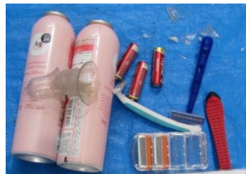
▲スプレー・電池・カミソリなど